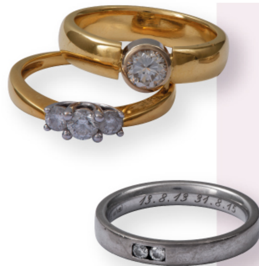
Ring mit WOW-Effekt

Aus meinen alten Ringen hat die Goldschmiede LESER meinen Traum wahr werden lassen. Mein funkelnder Märchenring aus 1001-Nacht!