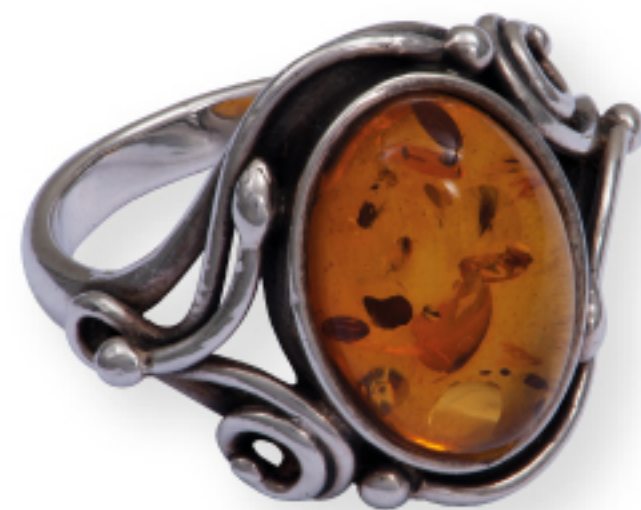
Bernstein neu interpretiert