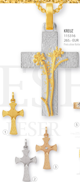
KREUZ 115316 265,- EUR Preis ohne Kette