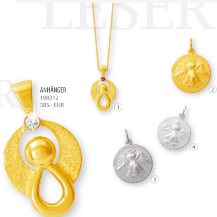
ANHÄNGER 108312 385,- EUR